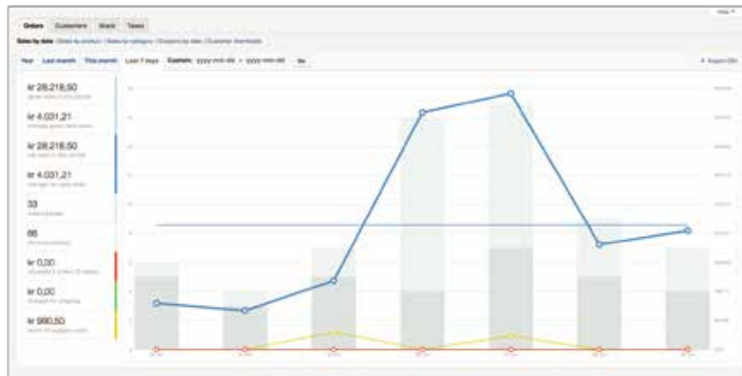
Ruutukaappauskuva järjestelmän myyntiraporteista