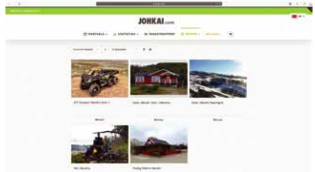
Ruutukaappauskuva Børselvan paikalliset palvelut osiosta, jossa paikalliset yritykset ja yhteyshenkilöt voivat markkinoida palveluitaan.

On meidän etumme mukaista, että paikallinen yhteisö pääsee osaksi järjestelmän tuomista eduista. Palvelussamme on mm. osio, joka tarjoaa mahdollisuuden paikallisille yrittäjille markkinoida palveluitaan järjestelmässä. Tämä mahdollistaa suuremmat tulot myös paikallisille yrityksille.